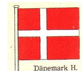
Danemark H. Le drapeau danois présente une croix

Autres contempteurs violents de l'islam : les ultra-laïcs qui se sont trouvé un nouveau cléricisme à combattre et croient futé de crier « Nous sommes tous des Danois ».