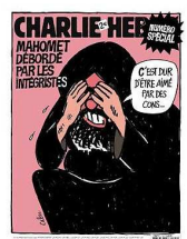
Quand Charlie-Hebdo devient nazi-hebdo...