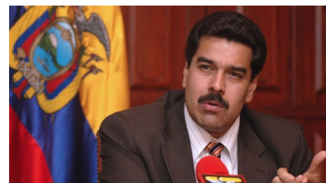
A voir ; Aidons l'Huma !